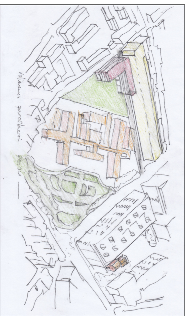
Volumenes parcelación PGOU