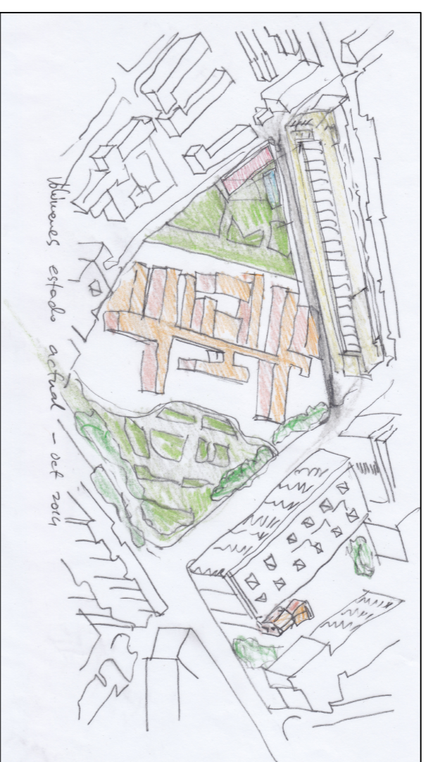
Volumenes estado actual